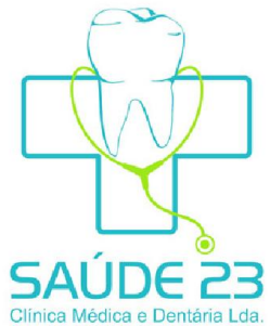
TABELA DE PREÇOS DOS SERVIÇOS DE ENFERMAGEM VALORES ACTUALIZADOS PARA O ANO DE 2014

CENTRO DE CULTURA E DESPORTO DOS TRABALHAORES DE VILA NOVA DE GAIA